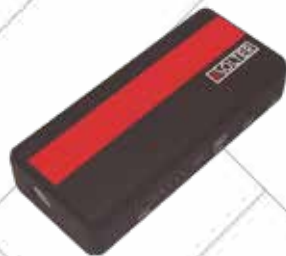
Cód. 115901 ARRANCADOR BATERÍA COCHE. SOLTER 12V, capacidad 15000mAh, arranque 600A. Para vehículos de hasta 6.000cc. Salidas USB 5V/2A, 19V/3,5A, 12V/10A. Carga cualquier tipo de móvil, tableta y ordenador portátil. Peso : 510gr. Se suministra con estuche, accesorios de carga móviles y pinzas de arranque. 119€ + 24,99 IVA = 143,99€