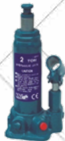
GATO HIDRÁULICO DE BOTELLA Cód. 109324: 2 toneladas de capacidad. Altura de elevación mínima 181mm y máxima 345mm. Recorrido 116mm + 48mm ajustables. Peso: 2,9kg. 12,50€ + 2,63 IVA = 15,13€ Cód. 109325: 3 toneladas de capacidad. Altura de elevación mínima 194mm y máxima 372mm. Recorrido 118mm + 60mm ajustables. Peso: 3,6kg. 14,75€ + 3,10 IVA = 17,85€