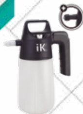
Cód. 83234 PULVERIZADOR INDUSTRIAL IK MULTI 1,5. IK

Capacidad útil 1 litro. Diseñado para aplicar productos químicos agresivos.