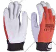
Cód. 115525, 115526, 115527 GUANTE MULTUSOS CON CIERRE TEXTIL ECO VEL. 3L Guante de piel flor de cabra en color natural con refuerzo en dedos pulgar e índice, así como en uñeros. Dorsal, aireado de tejido algodón 100%. Tallas 8, 9, 10. 2,25€ + 0,47 IVA = 2,72€