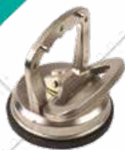
Cód. 97857 VENTOSA ALUMINIO PIHER VENAL 1.

PIHER Cuerpo fabricado en aluminio de alta densidad. Máxima capacidad de carga 40 kg