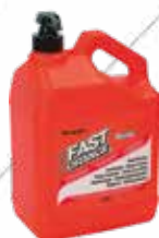
Cód. 68712 JABÓN LAVAMANOS. KRAFFT

Limpiador natural biodegradable. No contiene disolventes del petróleo. 3,78 litros.