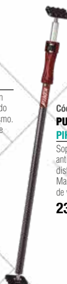
Cód. 51664 PUNTAL EXPANSIÓN P3.

PIHER Soporta hasta 300 kg. Zapatas antideslizantes adaptables a ángulos distintos. Tubo de acero de 1mm. Mango de nailon reforzado con fibra de vidrio, 155 - 290 cm.