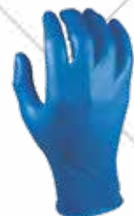
Cód. 119844, 119845, 119846 GUANTE DESECHABLE "GRIPPAZ". JUBA Adecuados para personas alérgicas al látex. Adecuado para el procesamiento alimentario. Color azul. Tallas S, M, L, XL. 10,50€ + 2,21 IVA = 12,71€