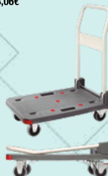
Cód. 96365 CARRO PLATAFORMA PT-150P. CARRIVAN Carga: 150 kg. Peso: 8,5 kg. Altura asa: 93 cm. Ruedas de goma y con rodamientos: Ø 10 cm. Grosor: 3 cm. Frenos en las traseras. Apilable. Plataforma: 46,8x74 cm. Polipropileno. Asa: Acero. Plegado: 46,80x74x27,4 cm. 55,50€ + 11,66 IVA = 67,16€