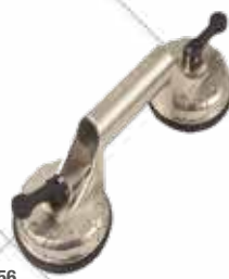
Cód. 97856 VENTOSA ALUMINIO PIHER VENAL 2.

PIHER Cuerpo fabricado en aluminio de alta densidad. Máxima capacidad de carga.