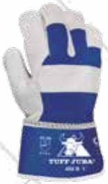
Cód. 110597, 110596 GUANTE SIDERURGIA SERRAJE LONA. JUBA Versión económica., refuerzos en nudillos y uñeros de serraje. Azul/gris. Tallas 9, 10. 1,95€ + 0,41 IVA = 2,36€