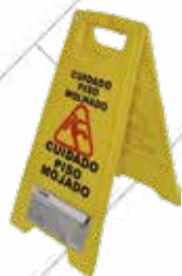
Cód. 96392 SEÑAL PELIGRO SUELO MOJADO. MADER