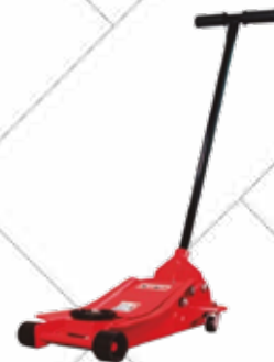
Cód. 101972 GATO HIDRÁULICO PERFIL BAJO 2,5 TONELADAS Hasta 2.500kg. Llantas de hierro y chasis de chapa de acero. Capacidad de carga: 2,5T. Altura mín.: 89mm. Altura máx.: 457mm. Altura de elevación- Peso neto: 36 kg. 118€ + 24,78 IVA = 142,78€