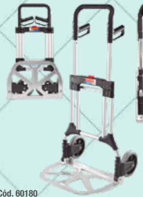
Cód. 60180 CARRETILLA SUPER-PLEGABLE S-200. CARRIVAN Carga: 200 kg Peso: 9,5 kg Altura: 127 cm. Gran base: 39x59cm. Ruedas de goma: Ø 20 cm. 89,25€ + 18,74 IVA = 107,99€