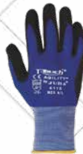
Cód. 110724, 110725, 110723 GUANTE "AGILITY T-TOUCH". JUBA Recubierto de nitrilo. Poliuretano. Color azul/negro. Tallas 8, 9, 10. 2,75€ + 0,58 IVA = 3,33€