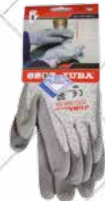
Cód. 110599, 110598, 110600 GUANTE "CONQUEROR II". JUBA Guante de fibra Dyneema® con recubrimiento de poliuretano en palma. Tallas M, L, XL. 7,50€ + 1,58 IVA = 9,08€