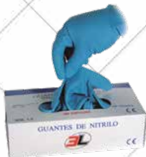
Cód. 80892, 80893, 80894, 80895 GUANTE LÁTEX DESECHABLE. 3L Sin polvo, gran gramaje. Tallas S, M, L, XL. Caja de 50 piezas. 9,50€ + 2,00 IVA = 11,50€