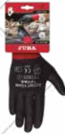
Cód. 106861, 106862, 106863, 106864 GUANTE "ECO-NIT FOAM" NAILON. JUBA Muy ligero y flexible, no produce fatiga en la mano. Muy ergonómico, sin costuras y óptimo ajuste a la mano lo que le proporciona mucho tacto. Tallas 7, 8, 9, 10. 2,25€ + 0,47 IVA = 2,72€