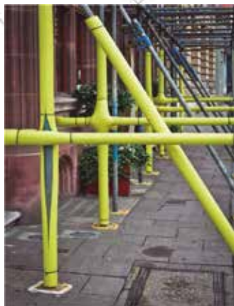
Cód. 117306 PROTECTOR ANDAMIOS

Tubo protector amarillo para la protección y señalización de andamios. Amortiguando posibles impactos o golpes contra el mismo. Ø50mmx200cm. Fabricado en espuma de PE expandido. Color: amarillo.