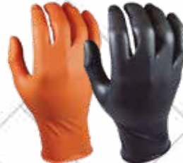
GUANTE DESECHABLE "GRIPPAZ". JUBA Guante de nitrilo desechable. Tallas M, L, XL. Caja de 50 piezas. Cód. 104438, 104439, 104440 Color negro Cód. 104441, 104442, 104443 Color naranja 5,25€ + 1,10 IVA = 6,35€