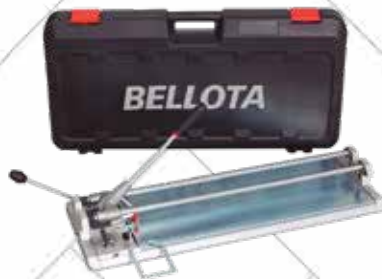
Cód. 117226 CORTADORA DE CERÁMICA PRO 72.

BELLOTA Base única de aluminio y superficie lisa de acero: Fácil limpieza y colocación de la baldosa. Para cortes rectos hasta 72 cm, cortes en diagonal 50 x 50 cm y espesor hasta 15 mm. Materiales medios y duros. Se sirve con maleta, Escuadra y rodil de 6 y 10 mm