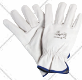
Cód. 61043, 61044, 61045 GUANTE FLOR VACUNO BLANCO. JUBA Confortable y flexible, óptimo tacto. Tallas 8, 9, 10. 2,50€ + 0,53 IVA = 3,03€