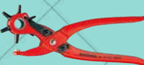
Cód. 36309 SACABOCADOS DE REVOLVER. KNIPEX Para realizar agujeros en material textil o plástico. Con 6 punzones intercambiables (2,0/2,5/3,0/3,5/4,0/5,0 mm). Con muelle de apertura automática y cierre de seguridad. Longitud 220 mm.