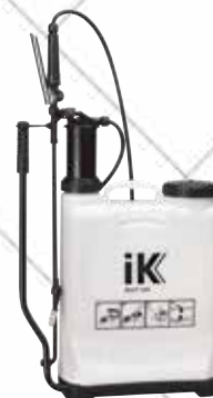
Cód. 43245 PULVERIZADOR INDUSTRIAL IK MULTI 12 BS. IK

Capacidad total y útil: 12 litros (mochila). Incluye kit con 2 boquillas. Especial aplicaciones industriales.