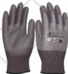
Cód. 110602, 110603, 110601 GUANTE ANTICORTE CATTER 5. 3L Fibra de vidrio con recubrimiento de poliuretano en la palma. Máxima resistencia al corte (nivel 5) y gran resistencia al pinchazo (nivel 3 de perforación). Tallas 8, 9, 10. 3,15€ + 0,66 IVA = 3,81€