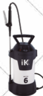
Cód. 117418 PULVERIZADOR INDUSTRIAL IK METAL 6. IK

Pulverizador fabricado en acero de 6 litros de capacidad útil. Posibilidad de pulverizar líquidos densos y/o calientes. Óptima resistencia respecto a disolventes derivados del petróleo.