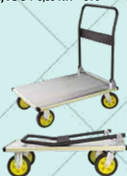
Cód. 102123 CARRO PLATAFORMA PT-300N. CARRIVAN Carga: 300 kg. Peso: 18 kg. Altura: 101 cm. Asa de acero plegable y plataforma de aluminio. Plataforma: 60x90 cm. Plegado: 60x90x32cm. Ruedas de goma. Ø18 cm. 88,50€ + 18,59 IVA = 107,09€