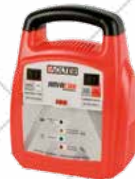
CARGADOR BATERÍA. SOLTER Con 2 velocidades de carga de 2,5A/5,4A. Mantenimiento vehículos recreativos, coches, furgones...etc. Cód. 74584: 10 amperios. Baterías hasta 120Ah 55,95€ + 11,75 IVA = 67,70€ Cód. 81909: 16 amperios. Baterías hasta 150Ah 74,95€ + 15,74 IVA = 90,69€