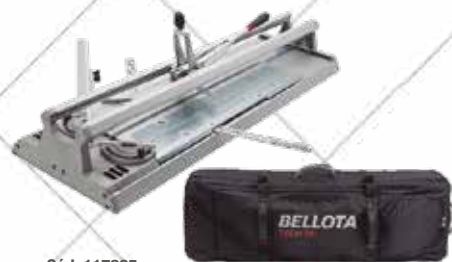
Cód. 117225 CORTADORA DE CERÁMICA TECH 125.

BELLOTA Robusta, precisa, y concebida para trabajar con grandes formatos. Muy ligera. Muy precisa, el diseño integrado de la máquina consigue un deslizamiento de la máxima precisión, incluso con las baldosas de mayor longitud. Bastan 2kg de fuerza para el rayado de la pieza. 125 cm