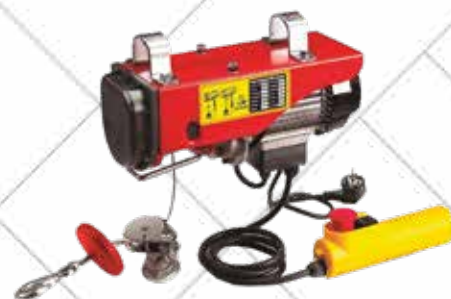
Cód. 96184 POLIPASTO

Polipasto de 1020 w, 230 V. - 50 Hz. Dotado de control de seguridad de baja y límite de subida para su seguridad. Gancho con cierre de seguridad. Con control de seguridad térmico.