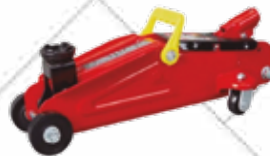
Cód. 101971 GATO HIDRÁULICO CARRETILLA 2 TONELADAS Hasta 2.000kg. De accionamiento hidráulico. Fabricado con mango desmontable para una mayor facilidad en el transporte. Capacidad de carga: 2T. Altura mín.: 140mm. Altura máx.: 340mm. Peso neto: 8,7 kg. 32,50€ + 6,83 IVA = 39,33€