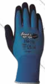
Cód. 119835, 119836, 119837 GUANTE "FEEL AND GRIP SPLASH". JUBA Doble recubrimiento de látex para mayor protección. Tallas M, L, XL. 2,95€ + 0,62 IVA = 3,57€