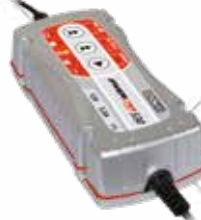
Cód. 63018 CARGADOR BATERÍA. SOLTER Cargador de baterías 12V, Automático-Inteligente de 4 etapas. 2 programas de carga constante 1Amp/3,5Amp (moto/coche). Para cargar baterías de hasta 75Ah y mantenimiento de hasta 120Ah. Ideal todo tipo de vehículos recreativos como motocicletas, quads...etc. Programa carga especial temperatura bajo cero. 67,95€ + 14,27 IVA = 82,22€