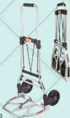
Cód. 66773 CARRETILLA SUPER-PLEGABLE S-90A. CARRIVAN Carga: 90 kg Peso: 4,8 kg Aluminio. Altura: 108 cm. Gran base: 34x48,5cm. Altura y base medidas XL. Ruedas de goma con rodamientos: Ø 17 cm. 42,15€ + 8,85 IVA = 51€