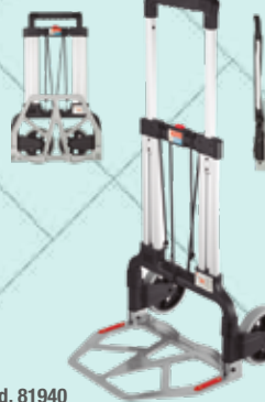
Cód. 81940 CARRETILLA SUPER-PLEGABLE S-125. CARRIVAN Carga: 125 kg Peso: 6,8 kg Altura: 109 cm. Base: 34x48,5cm. Ruedas de goma con rodamientos: Ø 17 cm. 56,25€ + 11,81 IVA = 68,06€