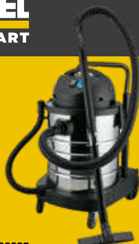
Cód. 106025 ASPIRADOR SOPLADOR INDUSTRIAL

Cód. 106024: 30 litros. 39,95€ + 8,39 IVA = 48,34€