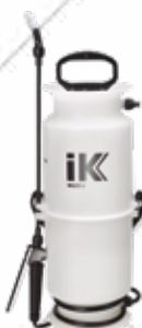
Cód. 43244 PULVERIZADOR INDUSTRIAL IK MULTI 9. IK

Capacidad total 9 litros. Capacidad útil 6 l.itros. Lanza orientable. Incluye kit con 2 boquillas. Especial aplicaciones industriales.