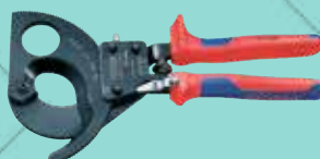
Cód. 39689 CORTACABLES DE CARRACA. KNIPEX Corta cables de cobre y aluminio, simples y múltiples. Capacidad de corte: hasta Ø 52 mm / 380 mm²