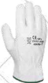
Cód. 110630, 110629 GUANTE FLOR VACUNO BLANCO. JUBA Piel flor vacuno grado B. C. Ofrece un buen confort y flexibilidad. Tallas 9, 10. 2,45€ + 0,51 IVA = 2,96€