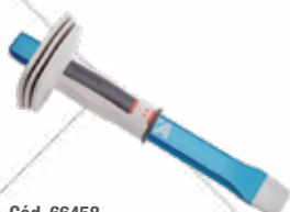
Cód. 66458 CORTAFRÍO CON PROTECTOR.

BELLOTA Acero cromo vanadio de máxima calidad. Puntas rectificadas, biseladas y barnizadas. Protector con tres labios, para mayor protección de la mano. 300mm.