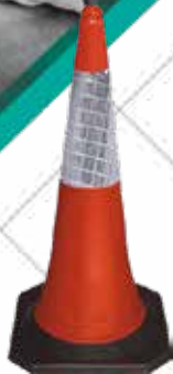
Cód. 75791 CONO SEÑALIZACION GOMA. JAR Cono de Polietileno 750 mm de polietileno con base de goma (2 piezas). Lleva una banda reflectante de 220 mm. Peso 2,50 kgs. 8,95€ + 1,88 IVA = 10,83€