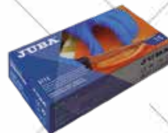
Cód. 118288, 118289, 118290, 118291 GUANTE DESECHABLE. JUBA Nitrilo sin polvo. Tallas S, M, L, XL. 9,95€ + 2,09 IVA = 12,04€