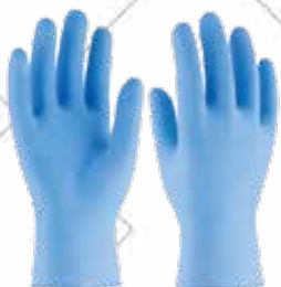
Cód. 80889, 80891 GUANTE DE NITRIL DESECHABLE. 3L Con certificaciones alimentaria, química, mecánica y bacteriológica. Tallas M, L. 5,95€ + 1,25 IVA = 7,20€