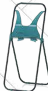
Cód. 48808 DISPENSADOR BOBINA

Diámetro del tubo 20mm, plástico ABS, conos adaptables a los ejes del papel.