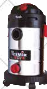
Cód. 80286 ASPIRADOR SÓLIDOS / LÍQUIDOS.

Filtro de cartucho recambiable que permite aspirar sólidos (incluido). Control de succión por entrada de aire en el mango. Conexión y desconexión automáticas de las herramientas eléctricas. Tanque de acero inoxidable 30 L. Bolsa de papel incluida.